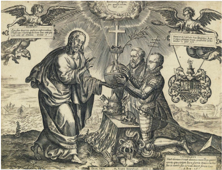
Hieronymus Wierix, El Salvador entrega las insignias del poder a Felipe II ante el Pontifice , incisione (1585).

potenza e della forza» 7 . Non solo, ma recentemente è stata messa seriamente in discussione anche la reale influenza esercitata dalla Spagna sulla Curia romana durante il regno del rey prudente , tanto più che a contendersi «il controllo delle relazioni» con la corte dei papi furono più fazioni, mutevoli e trasversali allo stesso tempo 8 . A ciò contribuì il «grande potenziamento della burocrazia pontificia dopo Trento e la sua organizzazione in funzione di una chiesa universale», con il rilancio del ruolo strategico della nunziatura di Madrid proprio a partire da Gregorio XIII 9 . In tale contesto, l'investimento di ingenti risorse finanziarie da parte di Filippo II, per procurarsi attraverso promozioni e pensioni il favore dei cardinali, non avrebbe prodotto un'adeguata contropartita in termini di lealtà politica, nemmeno durante i ponti-