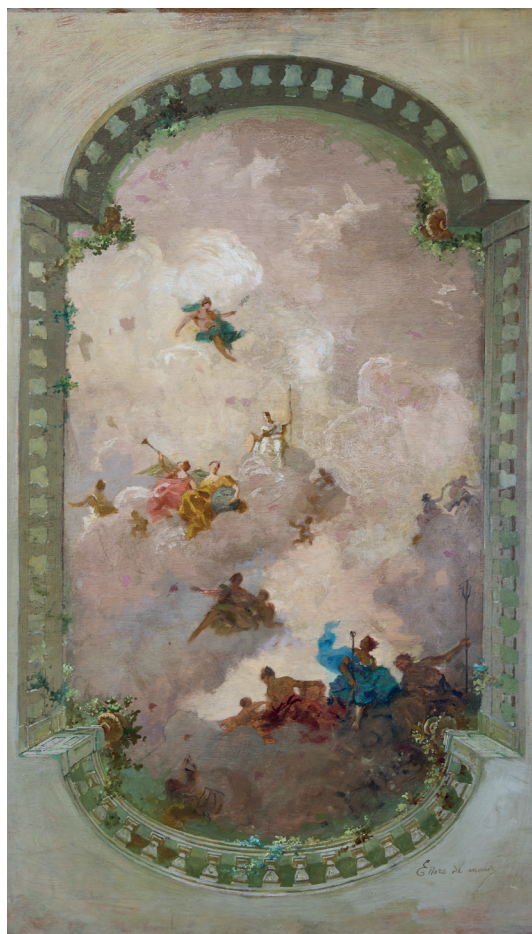
Fig. 4. Ettore De Maria Bergler, Bozzetto decorativo per il Transatlantico Giulio Cesare , 1920 circa, olio su compensato, 83,2x53,5 cm, collezione Sergio Sciascia, Palermo.

Grazie al costante aggiornamento critico su De Maria Bergler, con particolare riferimento all'unione di intenti con Basile e Ducrot, è possibile esprimersi con sempre maggiore consapevolezza nei termini di una felice collaborazione tra pari, sviluppata in sintonia con le tendenze europee dell'Art Nouveau, e oltre, da questi protagonisti della cultura figurativa e decorativa italiana tra XIX e XX secolo.