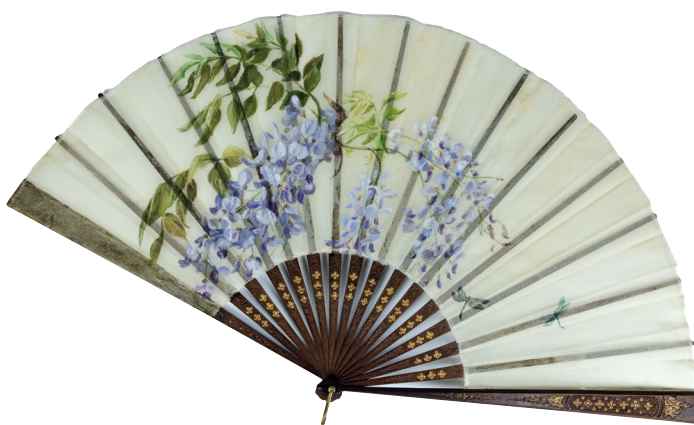
Fig. 1. Ettore De Maria Bergler, Ventaglio , seconda metà del XIX secolo, crepeline di seta dipinta a mano con pigmenti a tempera, 49x61 cm, collezione privata.

e decorative e proiettata alla fusione con l'industria, fu infatti determinante il ruolo di Vittorio Ducrot, imprenditore lungimirante che fu amico e sodale dell'artista e dell'architetto nonché promotore di importanti opere decorative, scaturite dalla contaminazione fertile fra le loro ricerche individuali. Nella fitta relazione tra Basile e Ducrot spicca la partecipazione a manifestazioni di rilievo internazionale, volte all'unità stilistica e all'integrità formale, come le Esposizioni di Torino del 1902 e Milano del 1906. Significativo in tal senso il giudizio de «L'Arte Decorativa Moderna» che riconosce «nell'industre fervore dello stabilimento Ducrot, animato dall'arte di Ernesto Basile, il primo centro creativo di un'arte decorativa moderna italiana 3 ».