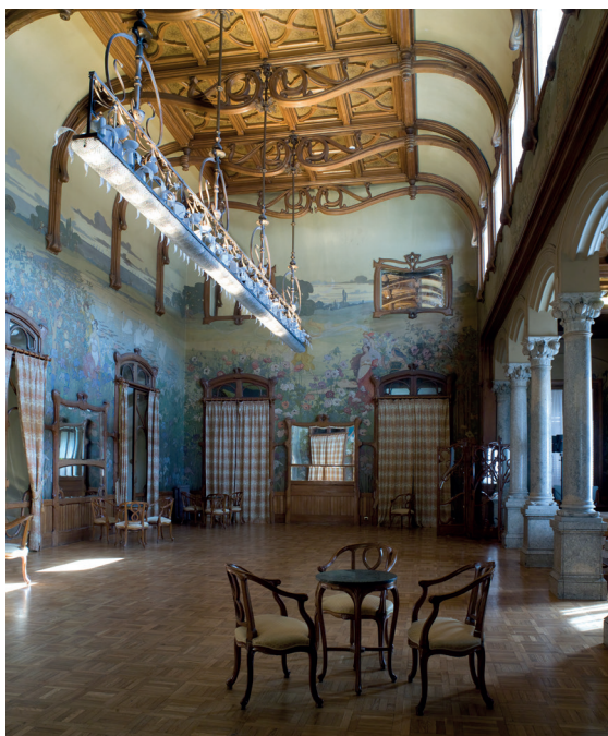
Fig. 2. Veduta dalla Sala degli Specchi o Sala Liberty di Villa Igea, 1899-1900, Palermo.