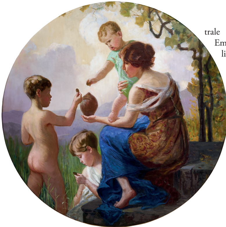
Fig. 3. Ettore De Maria Bergler, Allegoria del risparmio , 1915, olio su tela, 176x176 cm, Palermo, Sicily Art and Culture, società strumentale della Fondazione Sicilia.

rata, è degna di nota in riferimento a un settore particolarmente importante dell'attività di Ducrot 12 . Recentemente è stato infatti possibile mettere in luce il suo contributo fondamentale all'arredo navale, ulteriore settore in cui eccelse la società palermitana, che si contendeva il primato nazionale con la fiorentina Coppedè. De Maria Bergler, presente nelle più importanti navi del tempo con i propri dipinti, realizzò anche imponenti interventi decorativi, oggi perduti ma documentati da una serie di fotografie del Fondo Ducrot delle Collezioni Scientifiche del Dipartimento di Architettura dell'Università degli Studi di Palermo e non solo. Si tratta di un'espressione altissima del suo eclettismo colto, come si palesa per esempio nel Bozzetto decorativo per il Transatlantico Giulio Cesare del 1920 circa, di collezione privata, in cui putti e figure allegoriche si prestano a