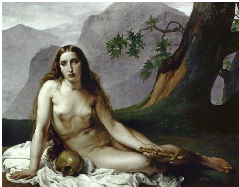
Fig. 10 – La Maddalena penitente , Francesco Hayez, 1833, olio su tavola, 118x141,5 cm, Galleria d'Arte Moderna, Milano.