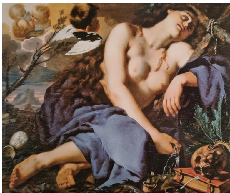
Fig. 5 – Esatasi di Santa Maria Maddalena , Alessandro Rosi, 1670 circa, olio su tela, 110x135 cm, Firenze, Galleria degli Uffizi, Galleria palatina.