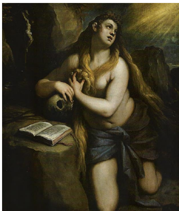
Fig. 4 – Santa Maria Maddalena penitente , Palma il Giovane, 1615 circa, olio su tela, 132x112 cm Bergamo, Accademia di Carrara.