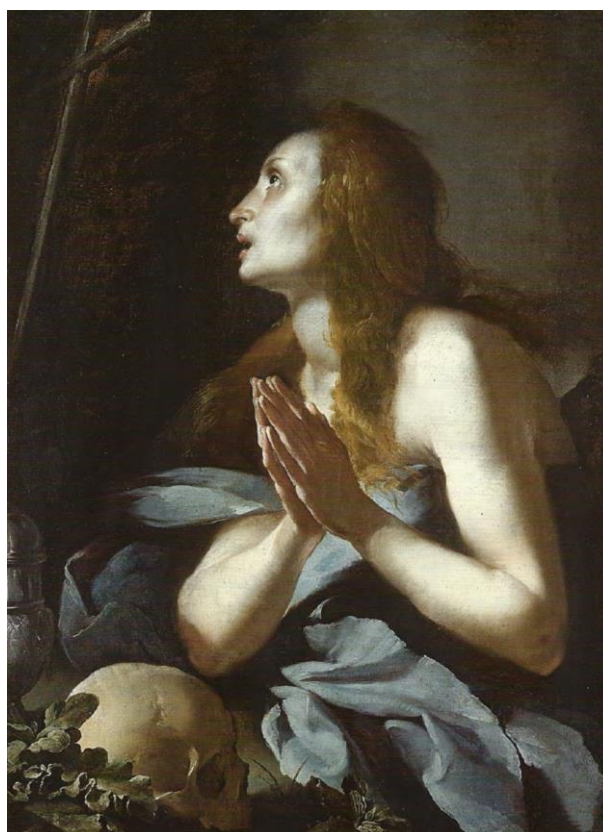
Fig. 3 – Santa Maria Maddalena penitente , Bernardo Strozzi, 1620 circa, olio su tela, 97x73 cm Genova, Musei di Strada Nuova, Palazzo Bianco.