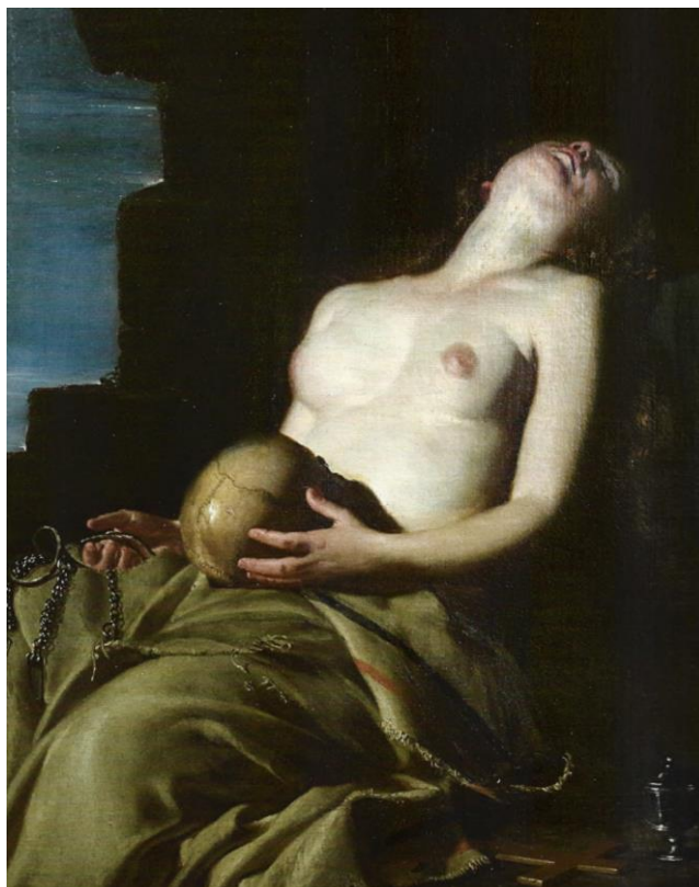
Fig. 9 – Santa Maria Maddalena penitente , Guido Cagnacci, 1626-1627, olio su tavola, 86x72 cm, Roma, Galleria Nazionale d'Arte Antica.