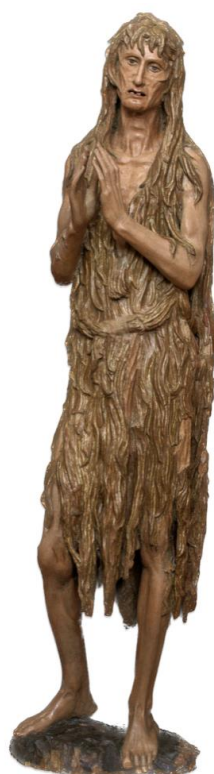
Fig. 8 – Santa Maria Maddalena penitente , Donatello, 1450-55 circa, legno, 185x5x45 cm Firenze, Museo dell'Opera del Duomo.