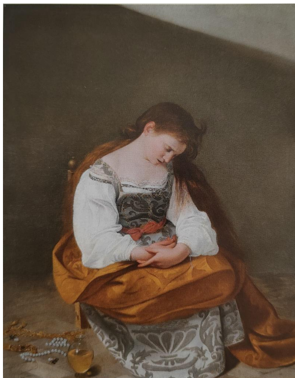
Fig. 1 – Maddalena penitente, Caravaggio, 1596-1597, olio su tela, 122,5x98,5 cm, Roma, Galleria Doria Pamphilj.