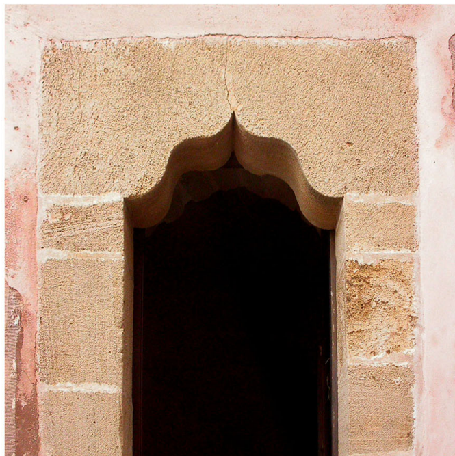
[6] CASTELLAMMARE. CASTELLO ALLIATA, DETTAGLIO DEL PORTALE DI SBARCO DELLA SCALA SULLA TERRAZZA, EN ESIVIAJE .

13. Le informazioni documentarie qui riportate, prevalentemente inedite, sono contenute nel prezioso contributo di P. Scibilia, La città di Pietro Speciale, repertorio documentario di fabbricatori e fabbriche, Palermo – secolo XV , Palermo 2022, pp. 245-267.