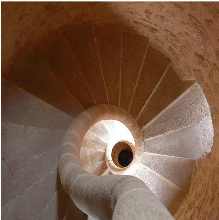
[7] CASTELLAMMARE. CASTELLO ALLIATA, DETTAGLIO DELLA SCALA A CHIOCCIOLA CHE PORTA ALLA TERRAZZA, DEL TIPO CARACOL DE MALLORCA.

realizzati in Sicilia, che potrebbe essere stato replicato successivamente nel campanile ottagonale del convento di San Domenico a Trapani. Gli esiti raggiunti in grandi residenze civili dell'aristocrazia locale dovettero comunque cogliere nel segno se il capomastro della città di Palermo, il trapanese Giacomo Bonfanti, lo scelse come socio nella realizzazione del palazzo di Giacomo Pilaya nel 1476 e, nello stesso anno, Gras venne indicato come perito per i lavori svolti nel Palazzo Pretorio 20 . Il resto della sua lunga attività comporterebbe ulteriori riflessioni, ma qui conta ribadire come nell'arco di pochi anni il processo di ambientamento si fosse compiuto.