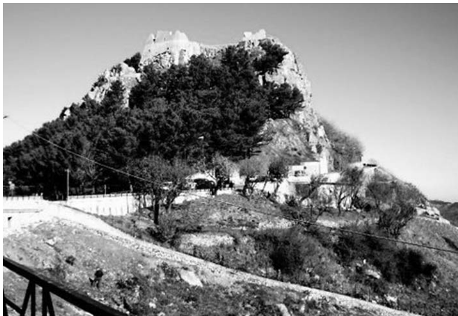
Geraci: la rocca.