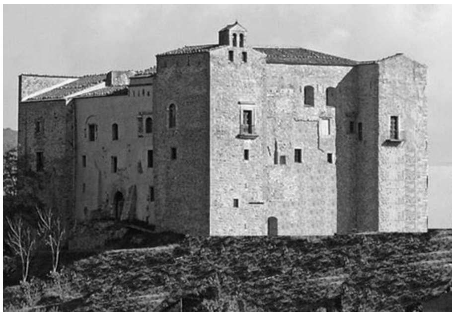
Castelbuono: il castello.