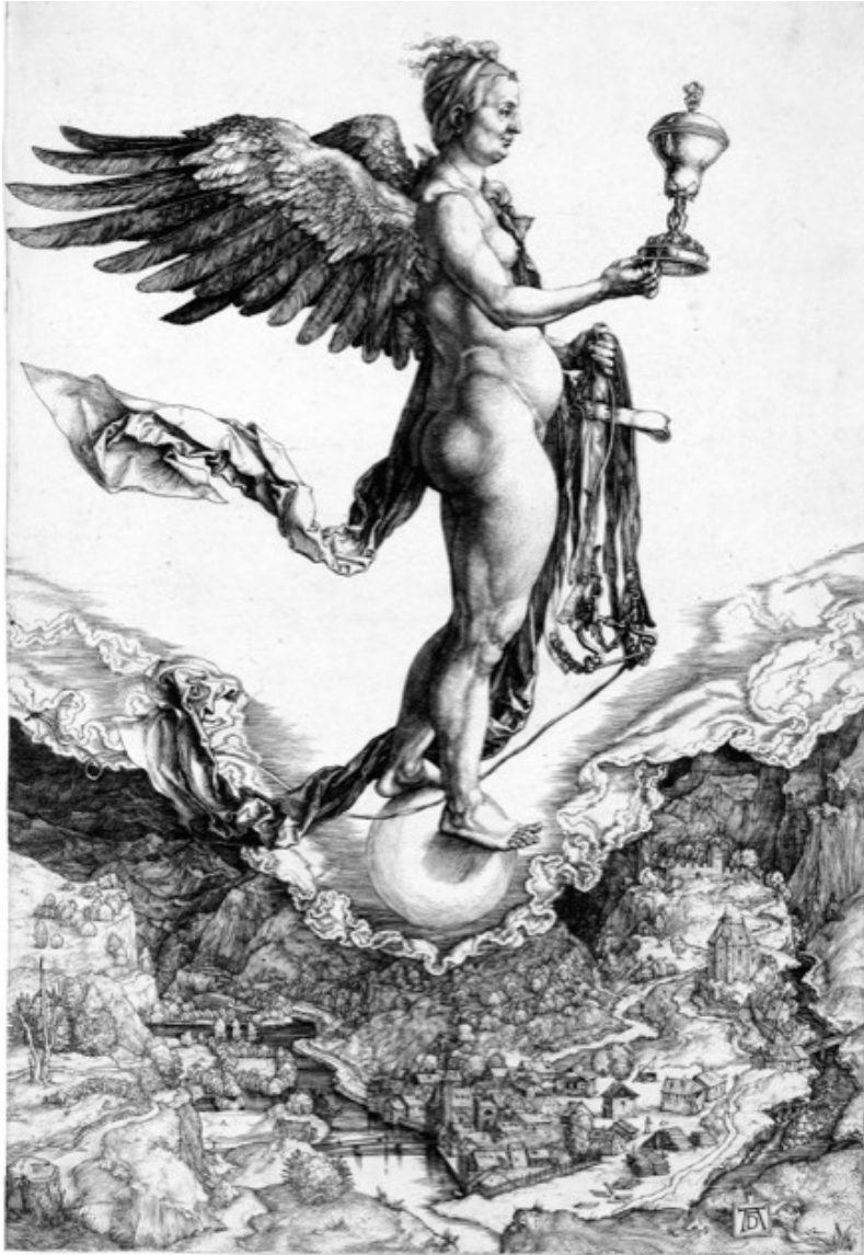
Fig.1 A. Dürer, Nemesis (1502), incisione, Staatliche Kunsthalle, Karlsruhe