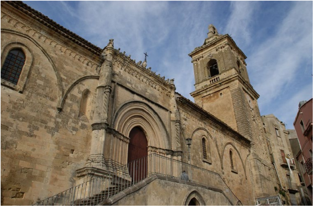
4: Chiesa Madre di San Gregorio Magno a Vizzini; si noti il portale tardo gotico, costituito da numerosi elementi di "spoglio". A destra è il campanile absidale, eretto da Mario Musumeci di Catania, inglobando la parte bassa del preesistente campanile sopravvissuto al sisma