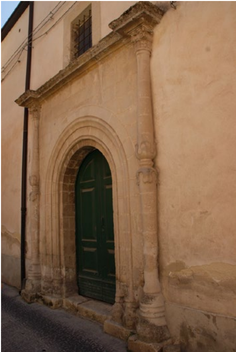
5: Portale laterale (XVI secolo) della chiesa di Sant'Agata a Vizzini.