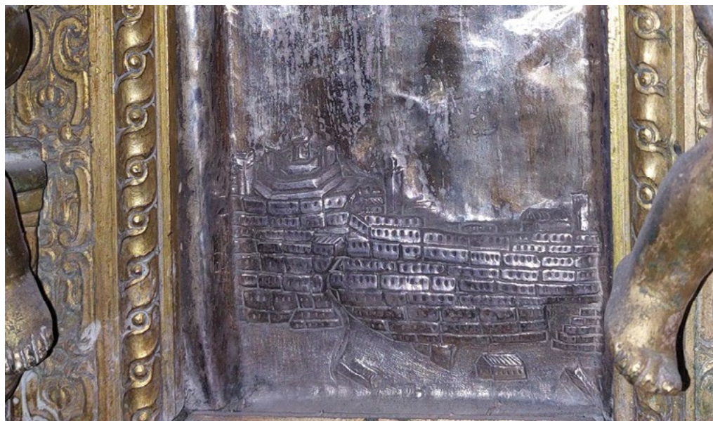
3: Veduta di Vizzini ante terremoto del 1693, plancia in argento alla base della statua del patrono San Gregorio Magno, chiesa Madre di San Gregorio Magno, Vizzini, 1660.