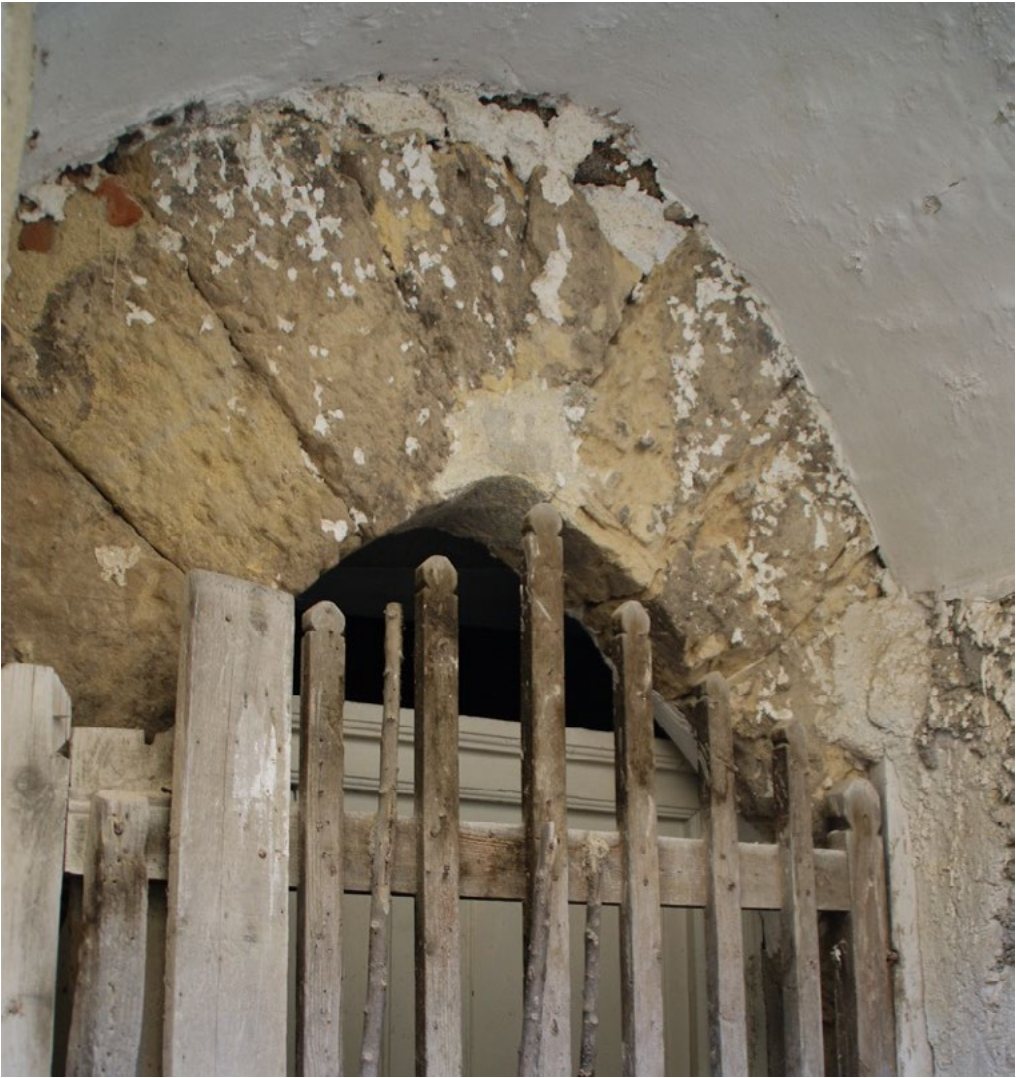
2: Tracce di tessuto edilizio medievale nel quartiere Matrice.

la fabbricazione di nuove case nello stesso sito di quelle diroccate, ammesso che la proprietà fosse detenuta da soggetti non disposti a ricostruire [Santoro 1927]. Unica veduta, ad oggi conosciuta, della Vizzini pre-terremoto è fornita da una plancia in argento alla base della statua di San Gregorio, patrono della città (Fig. 3). Nonostante la schematicità, si riesce chiaramente ad apprezzare la consistenza dell'abitato e, in alto, la presenza del castello circondato da un doppio circuito di mura e di alcune fabbriche chiesastiche: tra queste, sembrerebbe possibile riconoscere, da sinistra verso destra, la chiesa Madre, la chiesa di Sant'Agata ed infine la chiesa di Sant'Ippolito (?); più in basso, la chiesa di S. Giovanni Battista (?).