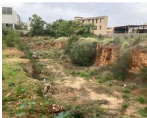
Fig. 2. Bordo est dell'area di villa Maltese a Palermo. Scorcio dello scavo di fondazione abbandonato.