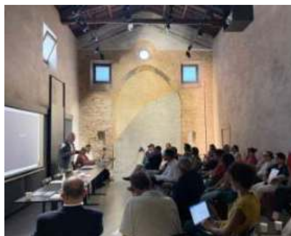
Fig. 3. Ex chiesa di San Lorenzo a Palermo. Incontro con i portatori di interesse istituzionali e sociali del progetto di rigenerazione proposto per il quartiere San Lorenzo a Palermo dall'Arch. Aldo Carano.