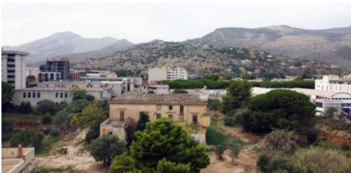
Fig. 1. L'area di villa Maltese, nella periferia nord di Palermo, vista da NE.

Se alla multidimensionalità si aggiunge l'origine multifattoriale, risulta evidente che la marginalità si configura come fenomeno cumulativo 2 e complesso, difficile da affrontare con completezza e da risolvere concretamente, per quanto circoscrivibile in precise delimitazioni. Simile complessità