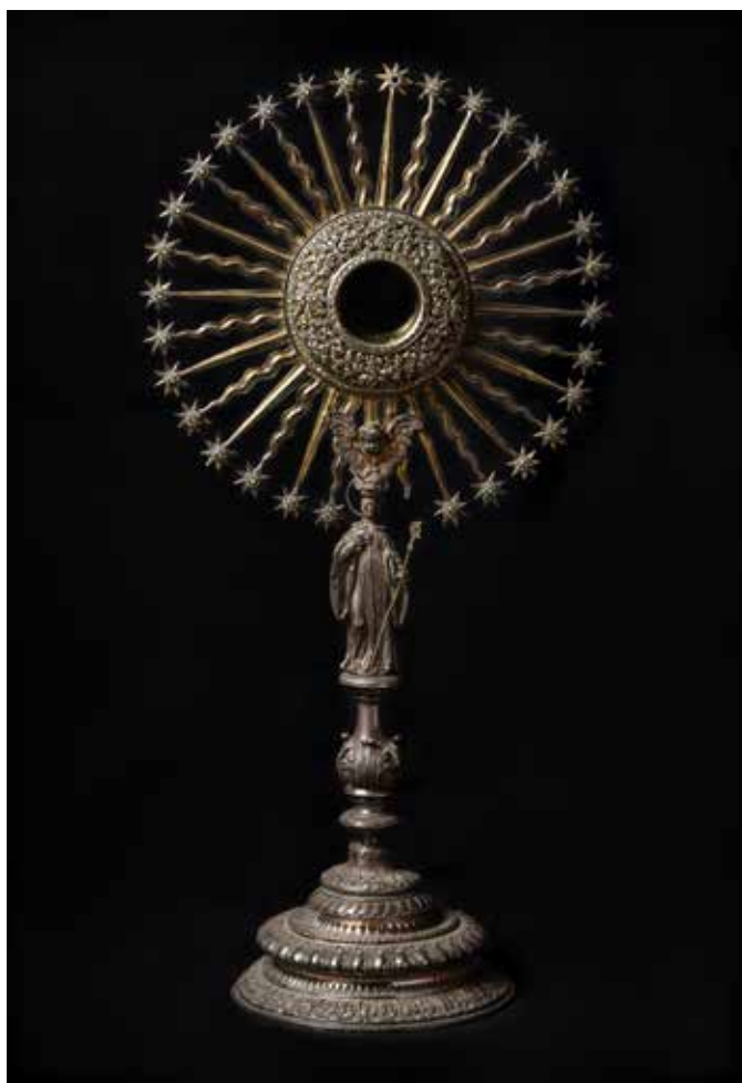
Fig. 1. Argentiere palermitano, Ostensorio con San Mauro , argento sbalzato, cesellato e inciso con parti fuse, gemme, diamanti e topazi, 1698, Caccamo, Chiesa Madre.