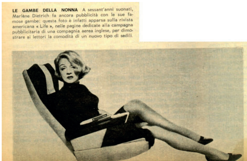
Fig. 2 - “Le gambe della nonna”, «Noi donne», a. XXI, n. 40, 9 dicembre 1965.