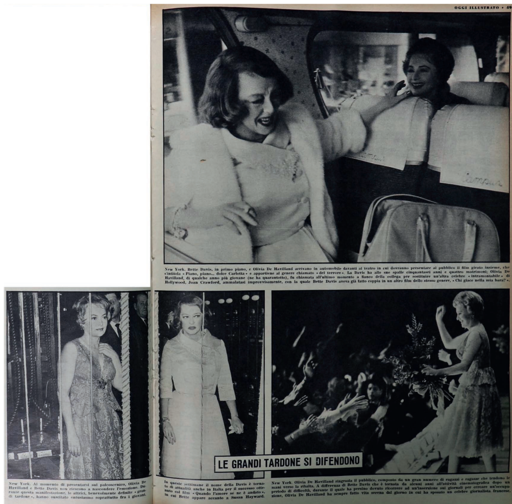
Fig. 1 - “Le grandi tardone si difendono”, «Oggi», a. XXI, n. 13, 1 aprile 1965.

L'autore aggiunge, inoltre, che Marlene Dietrich «a cinquantatré anni compiuti, afferma di non temere le insidie dello strep-tease [sic]». Si articola così l'«offensiva delle belle donne» 14 quarantenni, che si regge tutta sul mascheramento. L'articolo sembra riscontrare un'anomalia e rende nota la dominazione del sistema divistico da parte delle anziane (che in realtà, se guardiamo ai numeri proposti, sarebbero complessivamente circa un terzo del totale, mentre le over quaranta meno del 20%). La necessità di sottrarsi al tempo prende le forme discorsive del conflitto: si fanno strada concetti come quelli di «offensiva», «battaglia», «insidia», «timore», si parla di attrici che «le rughe e il tempo non hanno piegato» 15 . Nella scelta terminologica è esplicita la considerazione della terza età femminile, un tempo ritenuta «senza speranze» 16 , nei termini di una strenua lotta contro un nemico insidioso, che può essere combattuto (e vinto) solo con l'ausilio dei nuovi mezzi messi a disposizione dalla società dei consumi. Il contributo di Cavallotti appare peculiare nel ricostruire esplicitamente una relazione dinamica e conflittuale tra divismo ed età, ma il rapporto tra senilità e concezione della sessualità ricorre come un filo rosso in molti altri testi che lo stesso periodico propone al lettore (fig. 1).