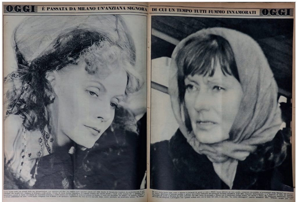
Fig. 3 - “È passata da Milano un’anziana signora di cui un tempo fummo tutti innamorati”, «Oggi», a. XVIII, n. 8, 22 febbraio 1962.

desiderabile ( Si risposa Lola Lola 56 , Invidia a... Marlene Dietrich 57 ), mentre il racconto della maturità di Garbo è tutto orientato in negativo, evocando immagini di sterilità e isolamento («La triste signora senza amore», con il «suo destino di solitudine interiore [...] ha pagato il suo successo con l’infelicità» 58 ). Due strategie sembrano allora concorrere a definire il divismo senile qui analizzato: la resistenza e la resa, reazioni entrambe che erompono in un regime segnato dalla forte conflittualità. All’invecchiamento visibile, in cui i segni del tempo sono palesi, corrisponde l’invisibilità dell’interprete, mentre la piena esposizione è concepibile solo laddove l’invecchiamento corporeo sia stemperato, occultato e vinto. Nelle sue declinazioni divergenti, la maturità femminile è comunque percepita come un fenomeno di deterioramento fisico e psichico, in opposizione a quella maschile ritenuta sovente un accrescimento in termini di esperienza, saggezza, fascino: basti menzionare titoli di articoli come I nuovi dongiovanni: tanti anni e pochi capelli 59 ; Gassman: ho avuto tre figli da tre mogli ma non ho chiuso, anzi 60 ; Con le rughe si seduce meglio 61 ; Sto vivendo la mia terza giovinezza 62 ; Perché tante ragazze sposano uomini che potrebbero essere loro padri? 63 .