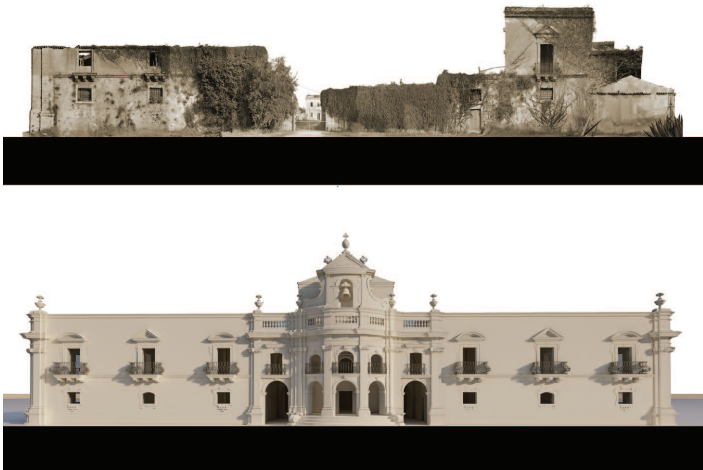
Fig. 4. Comparazione tra lo stato di fatto della Masseria Gargallo sita a Priolo e la ricostruzione digitale tridimensionale.

Sul disegno del palazzo Gargallo al Carmine in Ortigia: F. FAZIO, Un disegno di Paolo Labisi per Palazzo Gargallo al Carmine in Siracusa (1762) , in «Lexicon. Storie e architettura in Sicilia e nel Mediterraneo», 31, 2020, pp. 75-80.