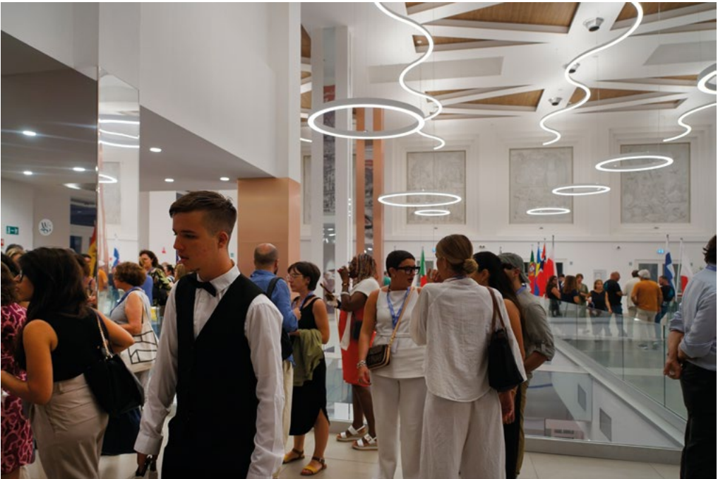
3-4: Libri all'AIU e aperitivo di benvenuto presso il Terminal Cruise Palermo, porto di Palermo, molo Vittorio Veneto, 10 settembre 2025. Books presentations at AIU and welcome cocktail at the Palermo Cruise Terminal, Port of Palermo, Vittorio Veneto Pier, September 10, 2025.