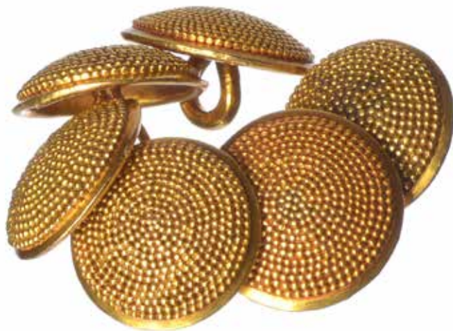
Fig. 4 . Orazi maltesi, Bottoni , seconda metà XVIII secolo, Malta, collezione privata.

dovrebbe riferirsi a bottoni o gemelli decorati con la tecnica della granulazione, ossia aggiungendo minuscoli granuli alla struttura del gioiello raggiungendo un ricco effetto strutturato, procedimento diffuso e distintivo dell'Isola dove viene denominato Gran Spinat (Spinal) 47 . Con tale tecnica in realtà venivano realizzate in origine soprattutto catene, indossate anche dagli ecclesiastici a supporto delle croci pettorali prima di diventare gioielli molto amati dalle donne 48 . Nel corso del diciannovesimo secolo tale tecnica fu poi ampiamente impiegata, sia in argento che in oro, per gioielli souvenir e fu molto apprezzata in Gran Bretagna 49 . La moda per i diamanti che dalla Francia aveva contagiato tutto il Vecchio continente, anche per il tramite culturale rappresentato da orafi e gioiellieri come il citato Francesco Vidal e dai loro disegni, finì per influenzare anche la creazione del più celebre gioiello associato a Malta, ovvero l'insegna dell'Ordine di san Giovanni 50 . La croce