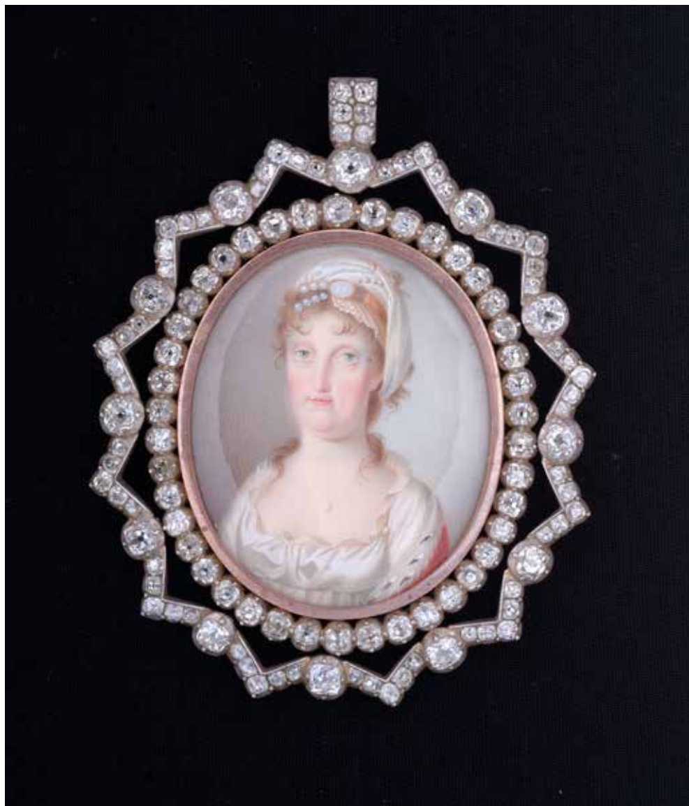
Fig. 3. Manifattura napoletana, Pendente Mattei , fine XVIII-inizi XIX secolo, Medina, tesoro della cattedrale di san Paolo.