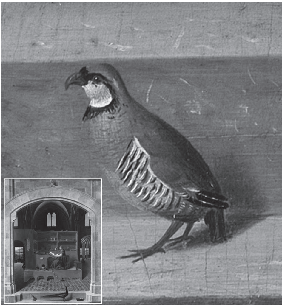
Fig. 1 - Particolare della “pernace” raffigurata nel “San Gerolamo nello studio” (riprodotto in basso a sinistra), conservato nella National Gallery di Londra.

specie, essa presenta una certa variabilità geografica, che ha consentito nel corso di un secolo di suddividerla in popolazioni geografiche morfologicamente riconoscibili a cui sono stati dati nomi sottospecifici, e precisamente: Alectoris graeca graeca (Meisner, 1804) (Grecia, Isole Ionie, Macedonia, Bulgaria, Albania), Alectoris graeca saxatilis (Bechstein, 1805) (Alpi italiane, francesi, austriache e slovene, Croazia, Bosnia, Serbia e forse Montenegro), Alectoris graeca orlandoi Priolo, 1984 (Appennino centrale e meridionale) e Alectoris graeca whitakeri Schiebel, 1934 (Sicilia, un tempo anche Pantelleria ed Eolie, ove è estinta). La forma più affine