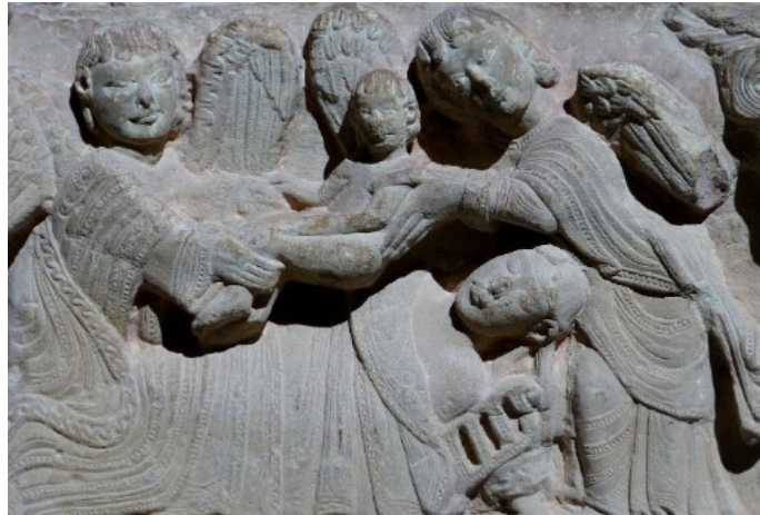
Fig. 3 - Particolare del sarcofago di Blanca Garcés de Navarra. Monastero di Santa María la Real de Nájera

A ventiquattro anni, incinta, muore Isabella d’Aragona (1247-1271), figlia di Giacomo I andata in sposa nel 1262 a Filippo l’Ardito, regina di Francia per circa cinque mesi.