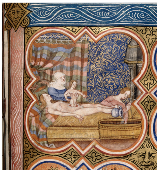
Fig. 2 - Nascita di Giulio Cesare ( Les anciennes hystoires rommaines ): la levatrice estrae il bambino. London, British Library , Royal 16 G VII f. 219, c.1400