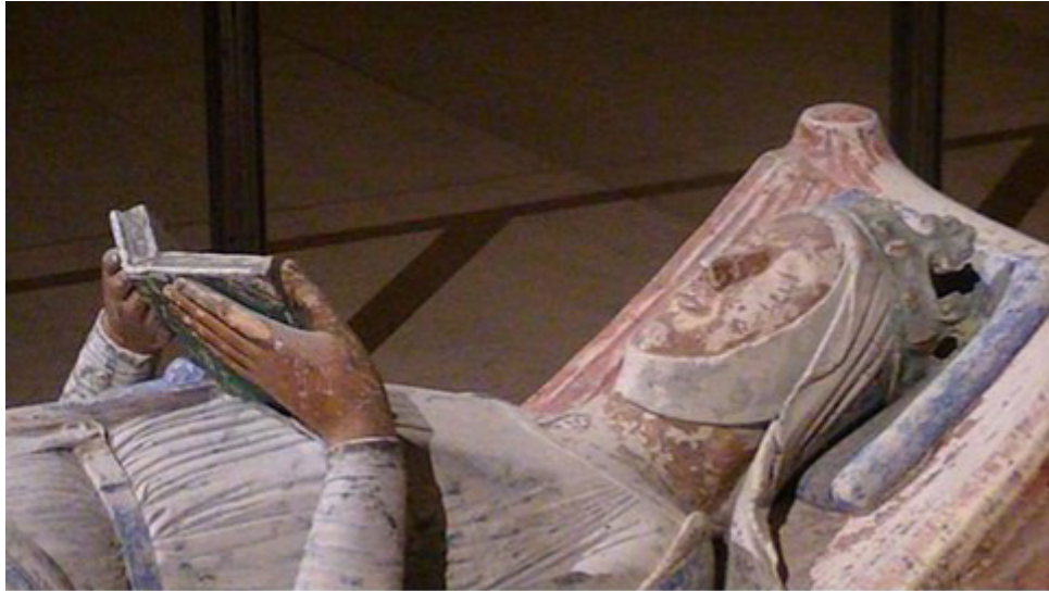
Fig. 1 - Gisant di Eleonora d'Aquitania. Chiesa dall'abbazia di Fontevraud

ne accusata di adulterio con Raimondo I di Antiochia. 7 Colta e sensibile, protettrice di artisti e letterati, dopo una vita lunga e turbolenta in cui aveva conosciuto la prigionia e seppellito otto dei suoi dieci figli, morì il 31 marzo 1204. 8 Il gisant , nell'abbazia di Fontevraud presso cui si era ritirata stanca e malata, la ritrae mentre legge un libro.