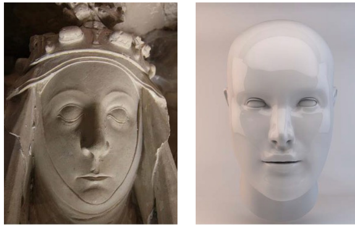
Fig. 5.1/ Fig. 5.2 - Bianca d'Angiò nel gisant / Ricostruzione facciale di Bianca d'Angiò di Santes Creus 62

Sui resti mummificati della regina 59 sono state di recente compiute delle indagini. 60 Possibile che l'entourage medico di corte praticasse trattamenti farmacologici, così almeno attesterebbero i resti di polline individuati sul corpo Bianca. Ulteriori analisi hanno accertato la presenza di artemisia nell'addome e ortica nella coscia: possibile che servissero da trattamenti ostetrici durante l'ultima fase del parto o subito dopo, date le proprietà correlate con mestruazioni, gravidanza, parto. 61