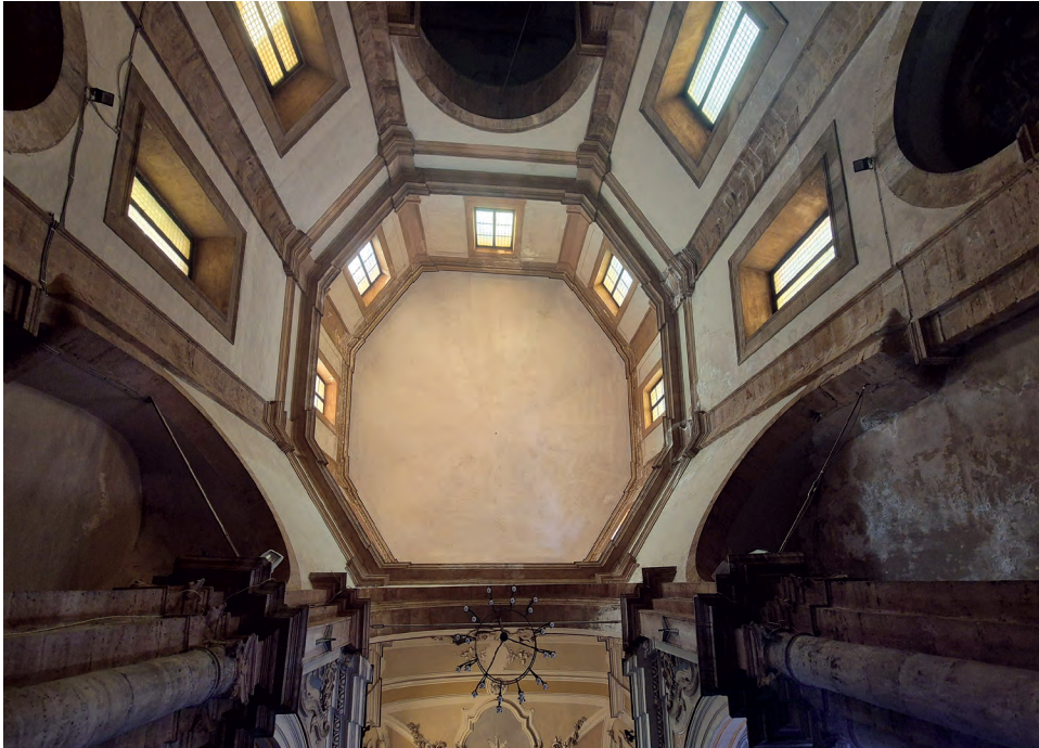
Fig. 5: Palermo. Chiesa di Santa Maria la Nova, interno con veduta della tribuna