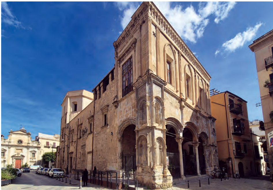
Fig. 2: Palermo. Chiesa di Santa Maria la Nova, veduta esterna