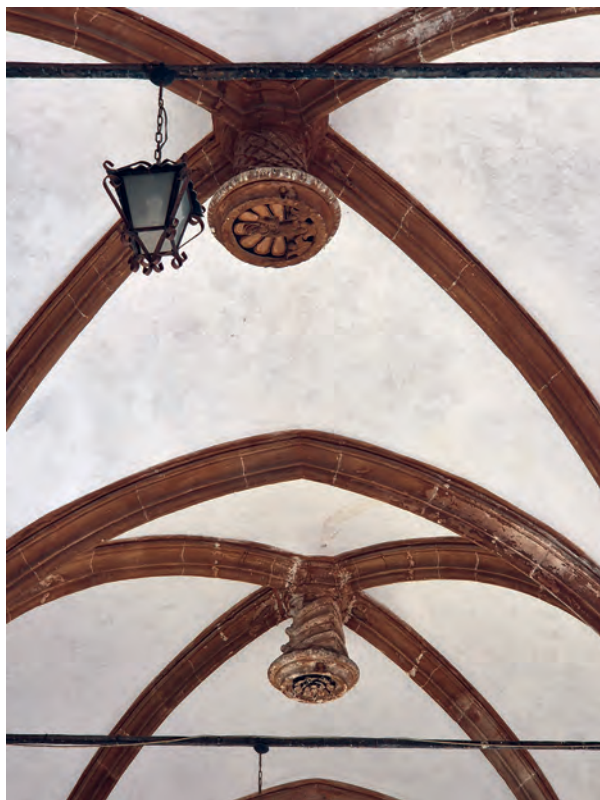
Fig. 3: Palermo. Chiesa di Santa Maria la Nova, particolare delle volte del portico