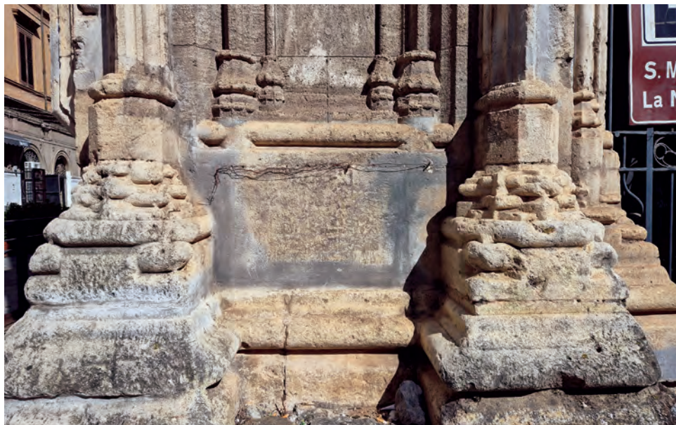
Fig. 4: Palermo. Chiesa di Santa Maria la Nova, particolare delle basi angolari del portico