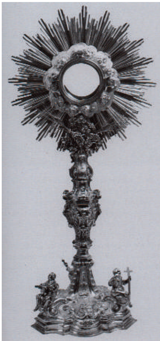
Fig. 5. Bonaventura Caruso (qui attr.), Ostensorio con Virtù teologali , 1784, argento sbalzato e cesellato con parti fuse, Geraci Siculo (PA), Monastero benedettino di Santa Caterina d'Alessandria.