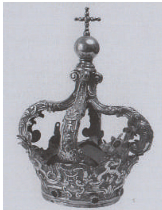
Fig. 11. Bonaventura Caruso (qui attr.), Corona per la statua dell'Immacolata , 1789, argento sbalzato e cesellato con parti fuse, Geraci Siculo (PA), Chiesa Madre di Santa Maria Maggiore.