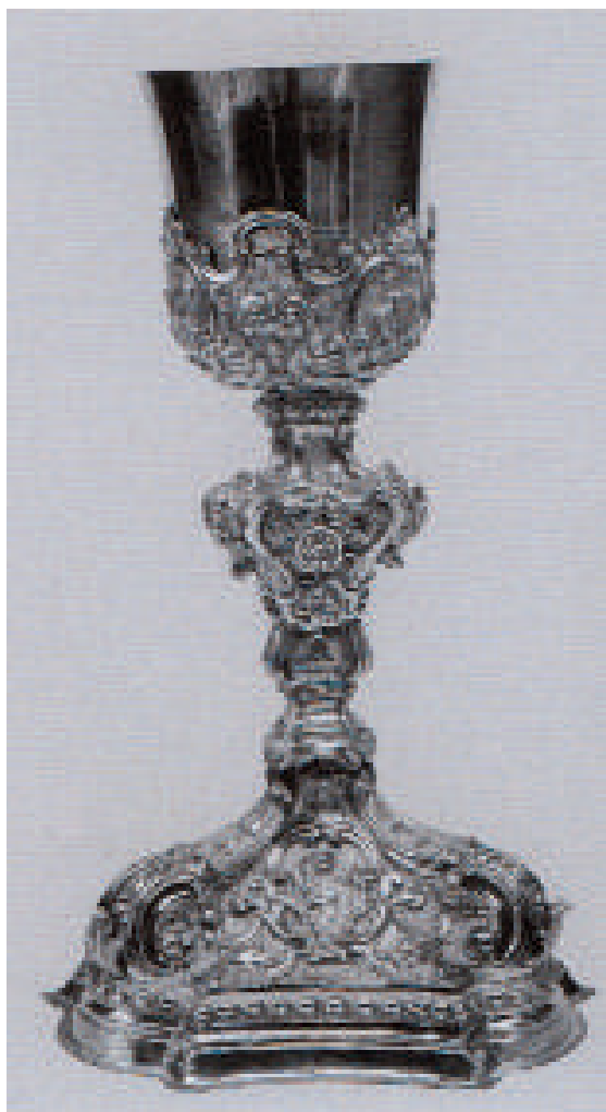
Fig. 7. Bonaventura Caruso (qui attr.), Calice , ultimo quarto del XVIII secolo, argento sbalzato e cesellato con parti fuse, Geraci Siculo (PA), Monastero benedettino di Santa Caterina d'Alessandria.

Aggiunte al catalogo di Bonaventura Caruso, sacerdote e orafo messinese