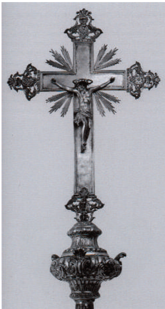
Fig. 8. Bonaventura Caruso (qui attr.), Croce astile , 1785, argento sbalzato e cesellato con parti fuse, Geraci Siculo (PA), Chiesa Madre di Santa Maria Maggiore.