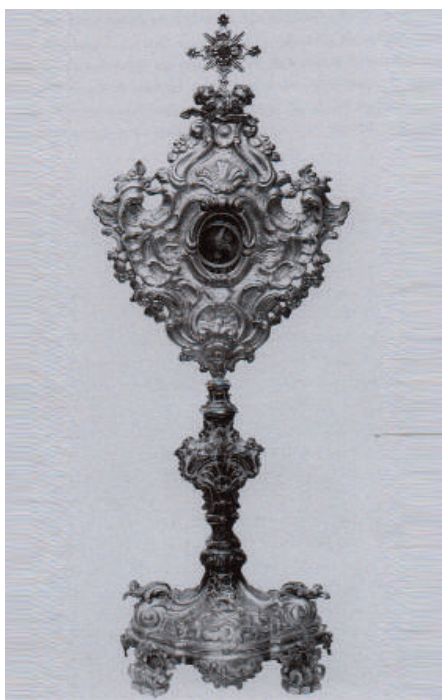
Fig. 14. Bonaventura Caruso (qui attr.), Reliquiario di san Bartolomeo, 1780, argento sbalzato e cesellato con parti fuse, Geraci Siculo (PA), Chiesa Madre di Santa Maria Maggiore.