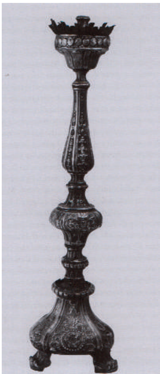
Fig. 3. Bonaventura Caruso (qui attr.), Coppia di candelieri , fine XVIII secolo, argento sbalzato e cesellato, Geraci Siculo (PA), Chiesa Madre di Santa Maria Maggiore