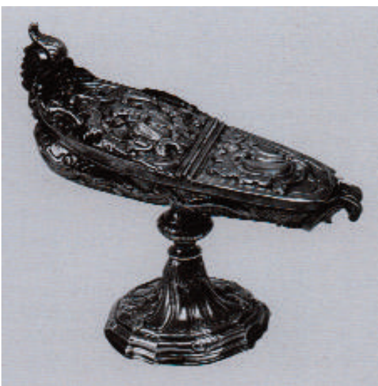
Fig. 12-13. Bonaventura Caruso (qui attr.), Turibolo e relativa navetta , 1779, argento sbalzato e cesellato con parti fuse, Geraci Siculo (PA), Monastero benedettino di Santa Caterina d' Alessandria.