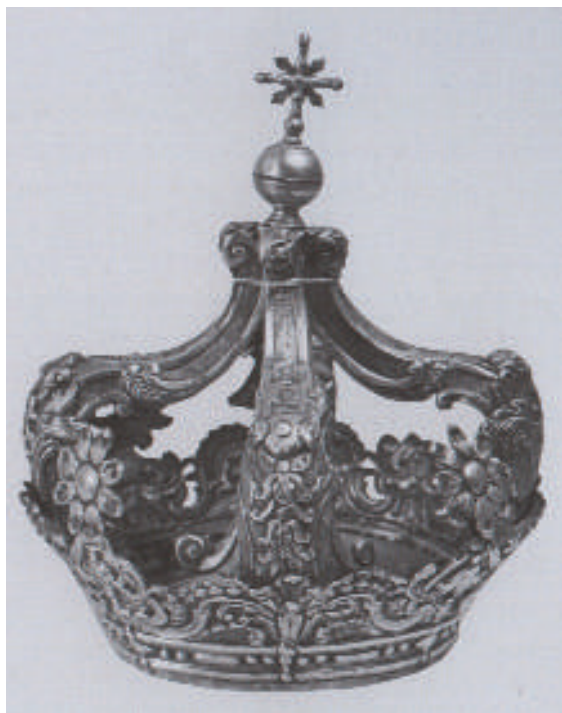
Fig. 10. Bonaventura Caruso (qui attr.), Coppia di corone da statua , 1783, argento sbalzato e cesellato con parti fuse, Geraci Siculo (PA), Chiesa Madre di Santa Maria Maggiore.