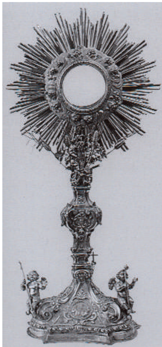
Fig. 6. Bonaventura Caruso (qui attr.), Ostensorio con simboli della Passione , 1785, argento sbalzato e cesellato con parti fuse, Geraci Siculo (PA), Chiesa Madre di Santa Maria Maggiore.

sina, F.F.85, S.B.) (Figg. 5 – 6); del calice, della croce astile e del vasetto per la purificazione (marchi: Messina, F.F.[**] e F.F.83, S.B.) (Figg. 7 – 8 – 9); delle corone per una Madonna e il Bambino e per l'Immacolata (Messina, F.F.83; Messina, G.<o C.>P.) (Figg. 10 – 11); del turibolo con rispettiva navetta (marchi: Messina, P.C., V.C.79) (Figg. 12 – 13); infine, dell'esuberante reliquiario di san Bartolomeo (marchi: Messina, P.C., P.L.80), di tre pissidi (marchi: Messina, P.C., P.R.C.88; la terza Messina, S.F.93) e di un calice dalle forme ormai regolari simmetriche spigolose e con ornati alla greca (marchi: Messina, C.P, G.C.98) 8 (Figg. 14 – 15- 16- 17 – 18).