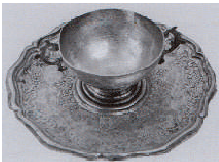
Fig. 9. Bonaventura Caruso (qui attr.), Vasetto per la purificazione , 1783, argento sbalzato, cesellato e inciso, Geraci Siculo (PA), Chiesa Madre di Santa Maria Maggiore.