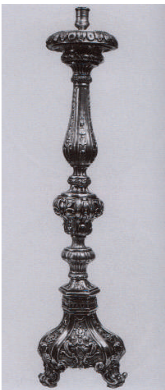
Fig. 4. Bonaventura Caruso (qui attr.), Candeliere , 1792, argento sbalzato e cesellato, Geraci Siculo (PA), Monastero benedettino di Santa Caterina d'Alessandria.

(marchi: Messina; Messina, D. <o P.?>L.94, C.P.) finora datati alla fine del XVII secolo e al 1694 -forse per le forme ancora arrotondate di nodi e fusto- ma con evidenti motivi decorativi Rococò tendenti al Neoclassicismo, che vanno più correttamente collocati alla fine del XVIII e al 1794 (Figg. 3 – 4); dei due ostensori (datati 1784 e 1785) recanti sulla base uno Virtù teologali e l'altro puttini con simboli della Passione (marchi: Messina, F.F.84, S.B.; Mes-