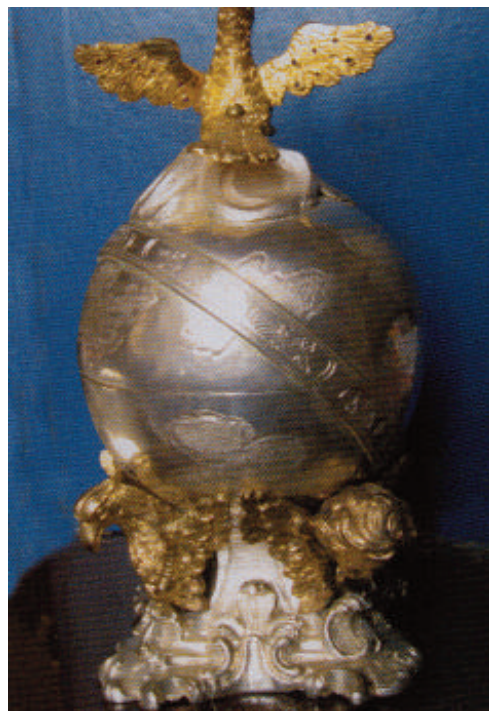
Fig. 25. Pietro Donia, Pisside , 1780, argento e rame dorato, rubini, Taormina (ME), Chiesa Madre di San Nicolò.