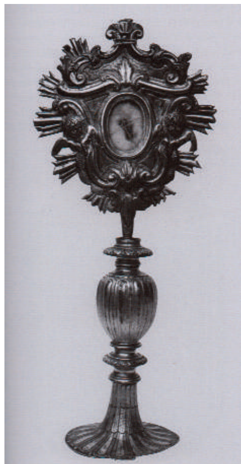
Fig. 2. Argentiere messinese e Bonaventura Caruso (qui attr.), Reliquiario di sant'Alberto , XVII secolo e 1791, argento sbalzato e cesellato, rame dorato, Geraci Siculo (PA), Chiesa Madre di Santa Maria Maggiore.

Potrebbe trattarsi, a mio avviso, rispettivamente: del nuovo ricettacolo realizzato nel 1791 (marchi: M.S.; O.L.91) per il già esistente reliquiario secentesco di sant'Alberto (Fig. 2); dei candelieri