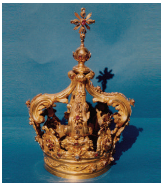
Figg. 19 - 20. Bonaventura Caruso, Coppia di corone per la Madonna dei Miracoli e il Bambino , 1783, oro e argento dorato sbalzato e cesellato con parti fuse; diamanti, smeraldi, rubini ed altee gemme policrome, Mistretta (ME), Chiesa Madre di Santa Lucia.