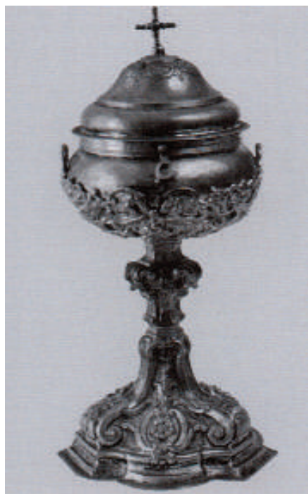
Fig. 17. Bonaventura Caruso (qui attr.), Pisside, 1793, argento sbalzato e cesellato con parti fuse, Geraci Siculo (PA), Chiesa Madre di Santa Maria Maggiore.