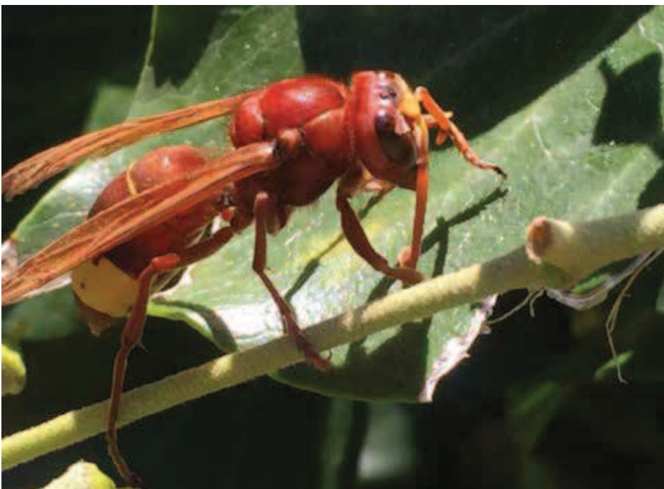
Fig 5. Adulto intento a raccogliere melata su foglia di edera

Il ciclo vitale di V. orientalis ha inizio in primavera quando le temperature cominciano ad aumentare e si protrae fino ad ottobre; in Sicilia le attività delle colonie continuano fino a metà novembre, come testimoniato da numerose osservazioni e segnalazioni; è chiaro che più le temperature autunnali si mantengono miti e più a lungo durano le colonie. Le nuove fondatrici, che hanno svernato in luoghi riparati e asciutti, escono dal torpore invernale e cominciano ad effettuare i primi voli perlustrativi; questi inizialmente hanno scopo esclusivamente trofico: ottime a questo proposito sono tutte le sostanze zuccherine che vengono trovate su piante e fiori (Ishay, 1964).