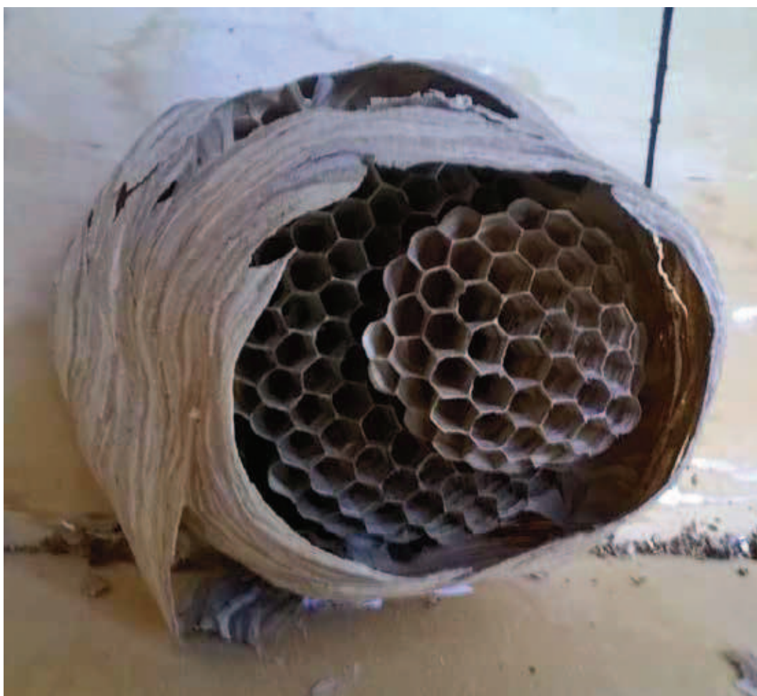
Fig 6. Struttura interna e cellette di un nido di calabrone

Dal momento in cui le operaie avranno raggiunto lo stadio di adulto, la fondatrice non uscirà più dal nido affidando i compiti di costruzione, manutenzione, pulizia, difesa e procacciamento del cibo alle operaie (Ishay 1973) e mantenendo, ovviamente, quello di deposizione delle uova. Nel giro di qualche mese il nido verrà ingrandito dal numero sempre crescente di operaie che lo popolano; esso è costituito da una serie di dischi, impilati orizzontalmente uno sull'altro e tenuti insieme da "piloni" in modo che resti uno spazio minimo che permetta alle vespe di poter camminare tranquillamente tra gli stessi. Le cellette saranno costruite soltanto sulla pagina inferiore di ciascun disco e saranno quindi rivolte verso il basso.