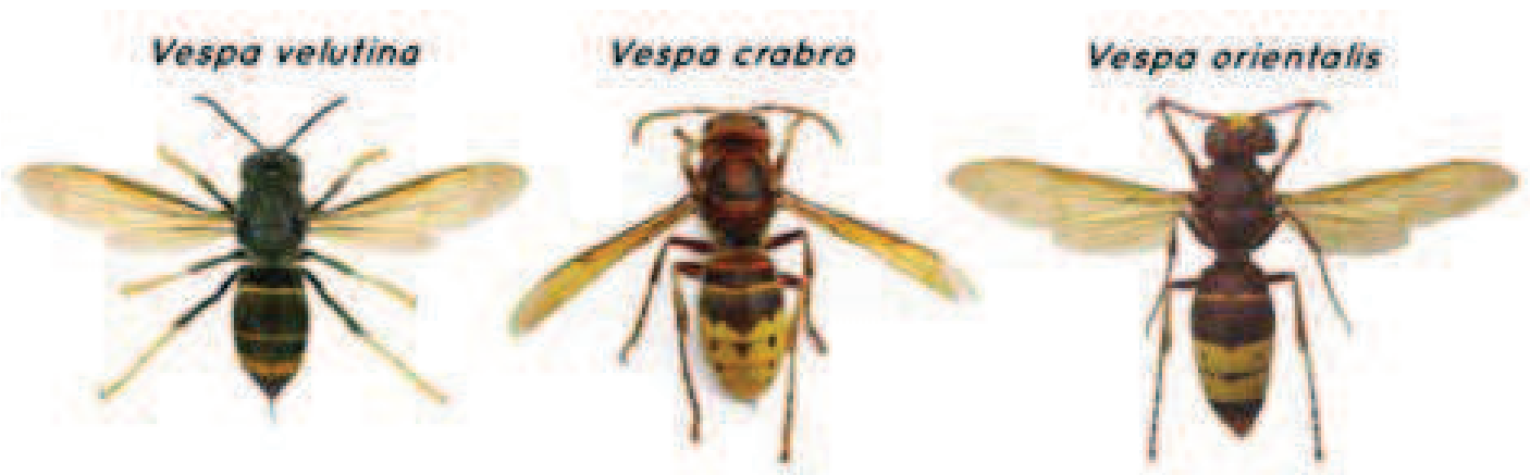
Fig.1. Femmine adulte delle tre specie

Le prime due sono autoctone: non inganni, in questo senso, la dicitura “ orientalis ” usata da Linneo, che fa, molto probabilmente, riferimento al luogo di segnalazione, situato “ab oriente” rispetto ad Uppsala, città dove viveva e studiava. La terza invece è di recente introduzione nel nostro paese (De Michelis et al. 2014). V. crabro è distribuita lungo tutto il territorio della penisola ed ha un areale pressoché stazionario sia geograficamente che demograficamente; V. orientalis invece è localizzata quasi esclusivamente nel sud Italia (Archer, 1998), anche se sono pervenute due recenti segnalazioni (agosto e settembre 2021) alla rete STOPVelutina che sembrerebbero confermare la presenza di tale calabrone in Toscana e Sardegna. Vespa velutina è segnalata in Italia, anche grazie al progetto Ministeriale (Mipaaf) “Stop Velutina”, in Liguria, Piemonte, Lombardia, Toscana Veneto ed Emilia Romagna. Queste ultime hanno un areale in continua espansione e modificazione; ma se questo fenomeno è facilmente spiegabile per una specie, come la V. velutina , che è stata segnalata per la prima volta a Loano (Liguria) nel 2014, più difficile appare per un'altra, come V. orientalis , che vive nel nostro paese praticamente da sempre; probabilmente i cambiamenti climatici e la grande capacità di adattamento in