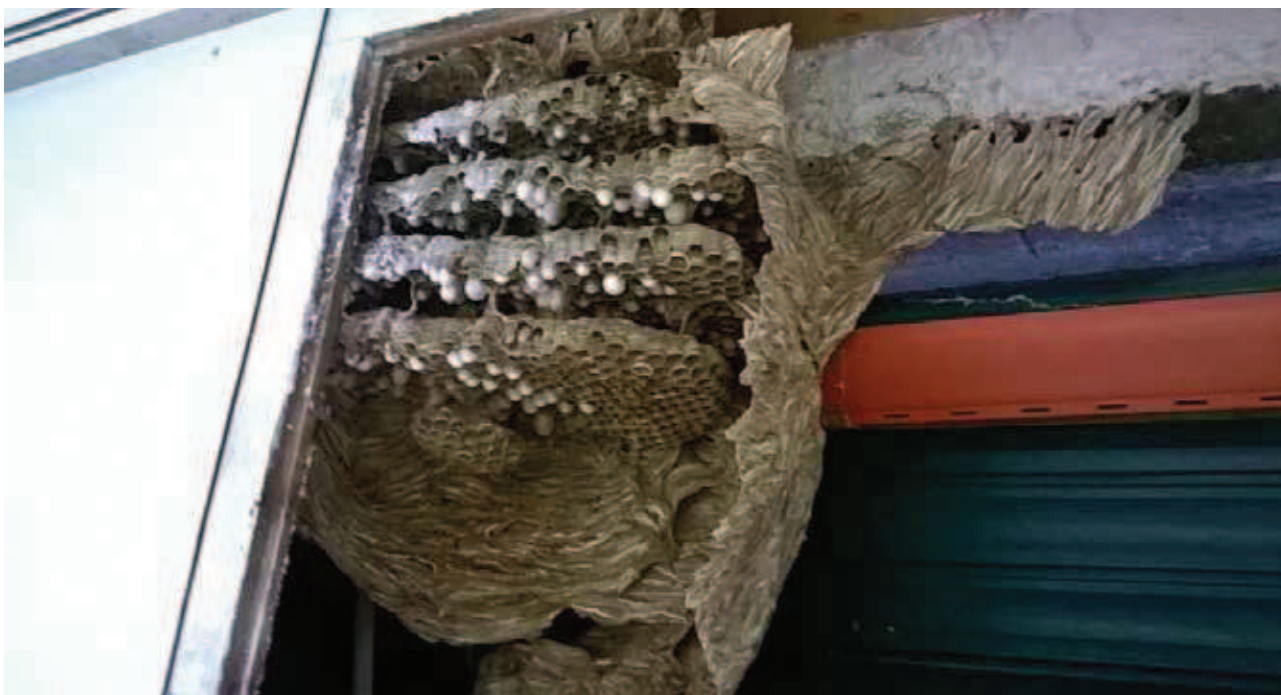
Fig 2. Nido di Vespa orientalis all'interno di un cassone per la serranda

risce per nulla l'insetto che, al contrario, trova questi luoghi molto confortevoli e ricchi di fonti trofiche per fondare nuove colonie e condurre una vita tranquilla. I nidi infatti vengono costruiti all'interno di cassoni delle serrande, anfratti nei muri, vecchie costruzioni abbandonate, magazzini, case abitate ecc. e in tutti quei posti dove è possibile trovare riparo e calore che si sostituiscono perfettamente alle gallerie sotterranee normalmente scavate e usate in campagna.