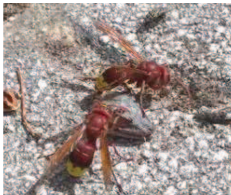
Fig 3. Operaie di V. orientalis su resti di carne e di una lucertola

La predazione rappresenta un importante metodo con cui procacciarsi il cibo; le api da miele (sia larve che adulti), soprattutto per V. orienta-