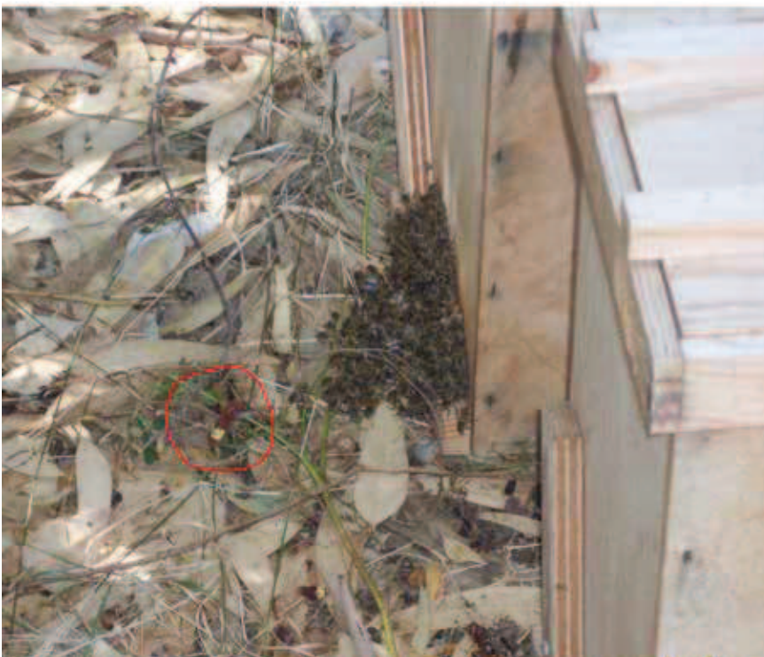
Fig 7. Adulto di V. orientalis mentre attacca un alveare di Apis mellifera

I calabroni sfruttano, per la ricerca del cibo, anche la predazione. Generalmente attaccano organismi moribondi o in difficoltà; anche esemplari appartenenti alla stessa specie sono oggetto di cattura qualora si verificano le condizioni prima menzionate. La preda preferita è però rappresentata da larve e/o adulti di A. mellifera . In questo caso gli alveari vengono attaccati anche se in perfetta salute.